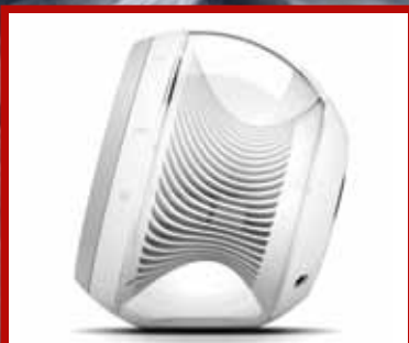
HARMAN KARDON Svestrani zvučnici