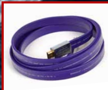
WIREWORLD Za bolju sliku i zvuk