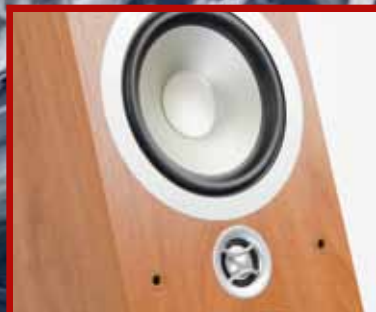
TANNOY Poboljšani bestseler