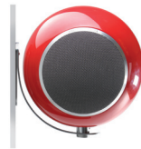
Support mural Wall mount bracket