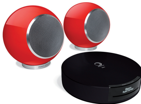
2 Planet L + Music Center BT + 10m cable